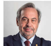
Carlos Mineiro, presidente del Consejo Mundial de Ingenieros Civiles