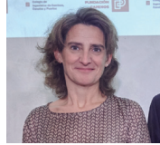
Teresa Ribera, vicepresidenta de Transición Ecológica y Reto Demográfico