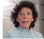
Isabel Celaá, ministra de Educación y Formación Profesional