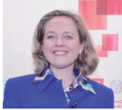
Nadia Calviño, vicepresidenta económica