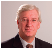
José Vieira, presidente de la Federación Europea de Asociaciones Nacionales de Ingeniería