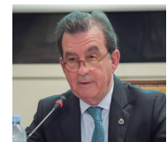
Carlos del Álamo, presidente del Instituto de la Ingeniería de España