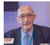
Jaime Lamo de Espinosa, presidente de Anci