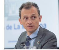
Pedro F. Duque, ministro de Ciencia