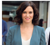
Isabel Díaz, presidenta de la Comunidad de Madrid