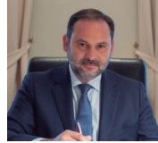
José Luis Ábalos, ministro de Transportes, Movilidad y Agenda Urbana