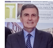
Pedro Saura, secretario de Estado de Infraestructuras