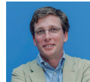
José Luis Martínez-Almeida, alcalde de Madrid