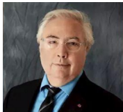
Manuel Castells, ministro de Universidades