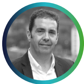
Juan Carlos Abascal Alcalde de Ermua