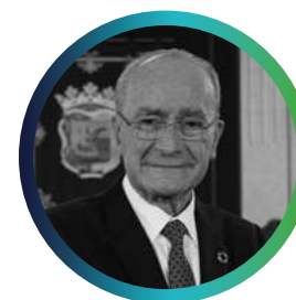
Francisco de la Torre Alcalde de Málaga