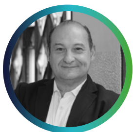
Carles Ruiz Alcalde de Viladecans