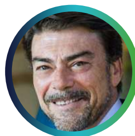
Luis Barcala Alcalde de Alicante