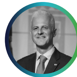
Pablo Hermoso de Mendoza Alcalde de Logroño