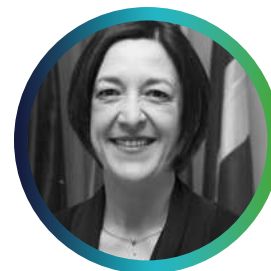
Fatimetou Abdel Malick Presidenta de la Región de Nuakchot