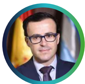
Miguel Ángel Gallardo Presidente de la Diputación de Badajoz y alcalde de Villanueva de la Serena.