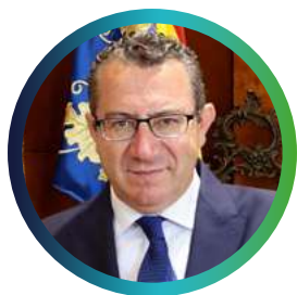
Antonio Pérez Alcalde de Benidorm